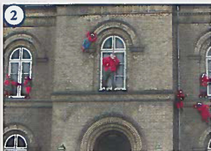
2 Borgmesternissen på Det gamle Rådhus Borgmesternisse Theobal forsøger at holde styr på rådhusets mange kravlenisser, der efter at have sovet på Rådhusloftet nu skal have brændt energien af, inden de atter skal op på loftet efter jul.