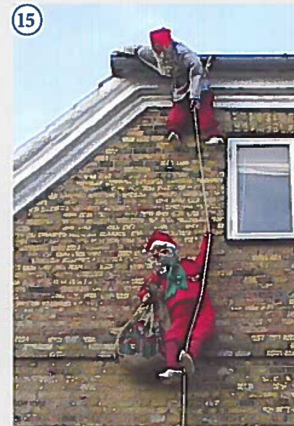
15 2 nisser på gavlen ved Imerco på Torvet Så er sækken fyldt og Laurits Klatrenisse er på vej op til Magnus Tagnisse med julegaver.