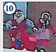
10 Far, mor og barn nisser over Kviklyd Outlet i Storegade Familien Nissen er på bytur for at se de mange flotte juleudstillinger i byens forretninger.