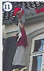
11 Nisserne over Data-Basen i Storegade Sådan kan det gå, når man er nysgerrig og vil kigge ind af folks vinduer. Godt nissefar heldigvis nåede at gribe nissemor, inden hun faldt ned.