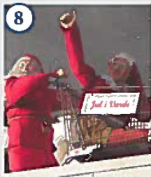
8 Nisserne over indgangen til Føtex, rundkørslen ved Ringkøbingvej Hr. og fru Nissen er på det store juleindkøb i Føtex. Mon ikke der venter lidt godter og gaver til deres nissebørn.