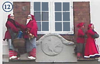
12 Nisserne over hovedindgangen til Den Kampmannske Gård i Storegade Nisserne, der bor på loftet i den gamle købmandsgård, elsker at blive luftet inden jul, og kigge på alle de travle mennesker, der kommer forbi med pakker under armene.