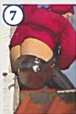
7 Nissen på taget af toiletbygningen, Fogtmanns plads Dem der ingen bukser har – de må gå med numsen bar. Selv en nisse kan blive trængende og da der var optaget på toiletlet, måtte Søren Potnisse ty til natpotten på taget.